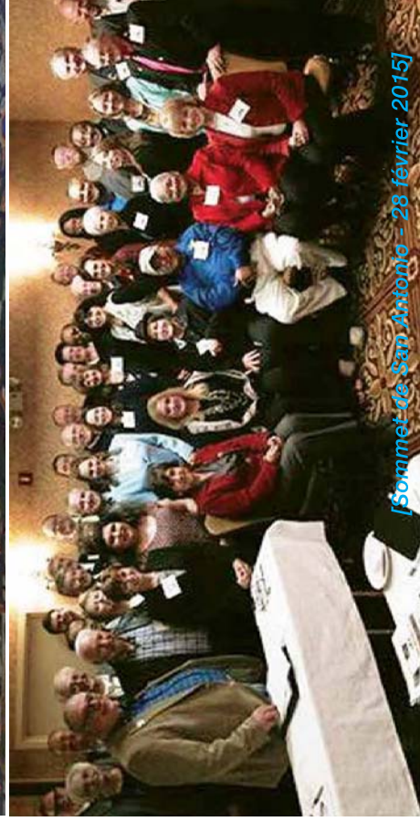
[Sommet de San Antonio - 28 février 2015]