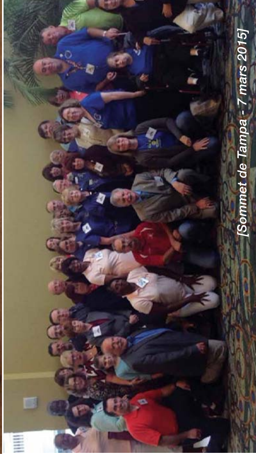
[Sommet de Tampa - 7 mars 2015]