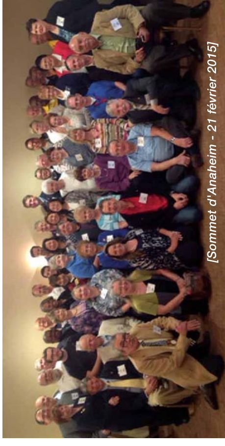
[Sommet d'Anaheim - 21 février 2015]

Pour plus d'information sur les Sommets sur le leadership 2015, visitez le www.optimiste.org/sommets/