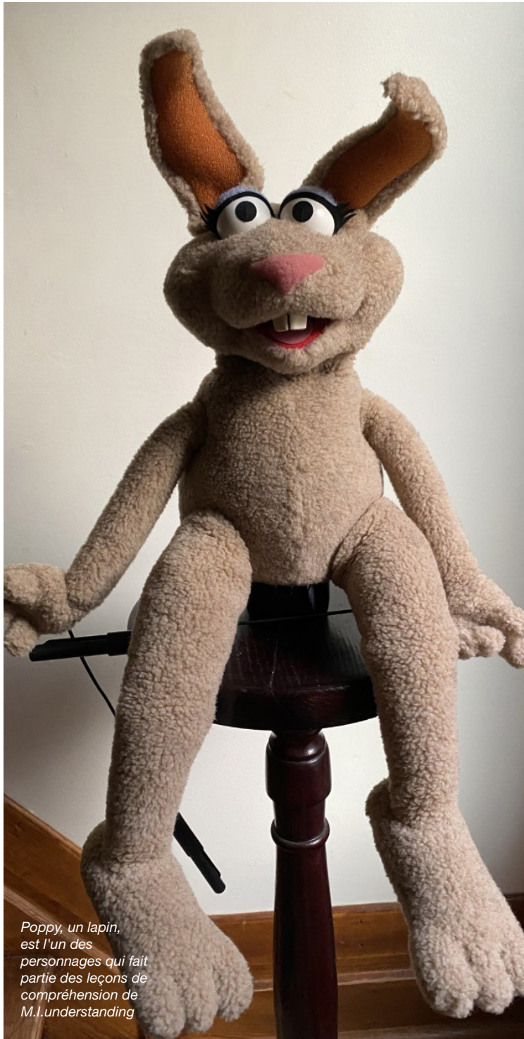
Poppy, un lapin, est l'un des personnages qui fait partie des leçons de compréhension de M.I. understanding

Programme de soutien aux Optimistes pour aider les familles à s'orienter dans le domaine de la santé mentale des jeunes